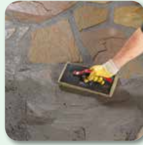
diagonal zur Fuge abreinigen