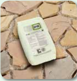
Flächen rückstandsfrei reinigen