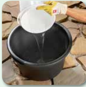
max. 3,5 l Wasser vorlegen