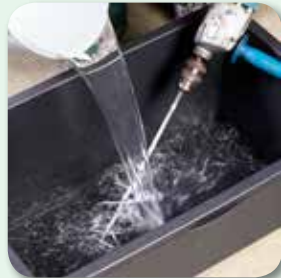
5 bzw. 7 l Wasser vorlegen