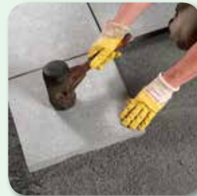
Verlegung „frisch in frisch“