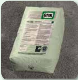
Unterbau, Tragschichten und Bettung vorbereiten