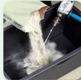
vdw 495 hinzufügen und homogen anrühren