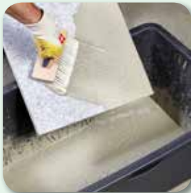
... quasten ...