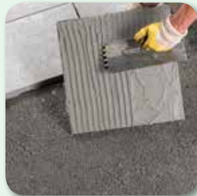
oder mit dem Zahnspachtel auftragen.