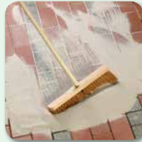
... vollständig füllen