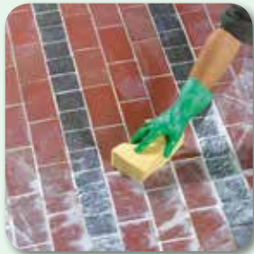
Reste mit feuchtem Schwamm aufnehmen