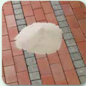
Fugen mit Quarzsand ...