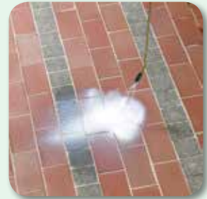
Fugen satt mit vdw 870 tränken