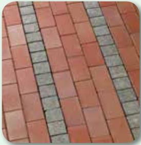
Oberflächen rückstandsfrei reinigen