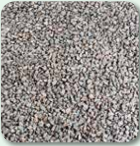
Unterbau und Tragschichten vorbereiten