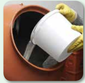
max. 6 % Wasser zugeben