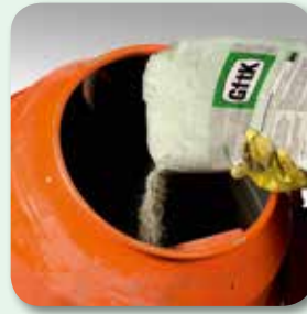
... und entsprechende Menge vdw 480 vormischen