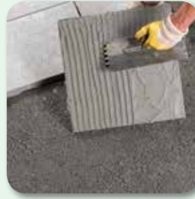
bei Platten unterseitig Haftschlämme auftragen