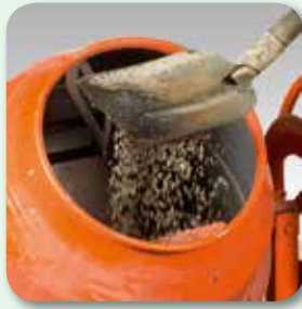
geeigneten Mineralstoff ...