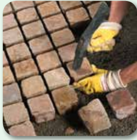
Pflaster hammerfest setzen