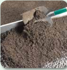
Mörtel aufbringen und über Lehren abziehen