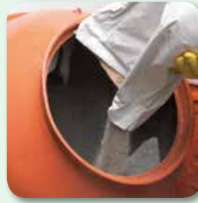
vdw 490 hinzufügen