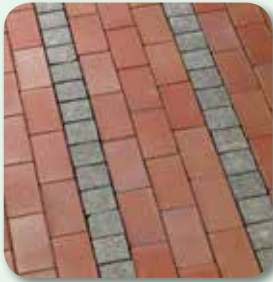
Oberflächen rückstandsfrei reinigen